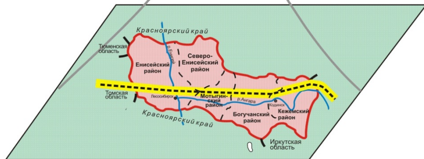
Пространственная структура Нижнего Приангарья