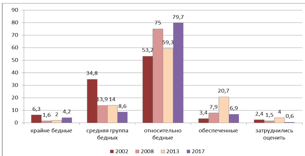
Рис. 6.5. Оценка сельскими жителями материального положения своих семей, % (по опросам в 2002, 2008, 2013 и 2017 гг.)

Далее масштабы и глубина бедности продолжали сокращаться, и по опросу 2013 г., основные подвижки произошли уже за счет перемещения из относительно бедных в группу обеспеченных: доля тех, кто может без труда приобретать себе любые товары длительного пользования и более богатых, составила уже около 20%, т.е. выросла более чем в два раза за предшествующие 5 лет (рис. 6.5). Рост социально-экономического неравенства при сокращении бедности отразился на повышении размеров миграционных установок сельских жителей 1 .