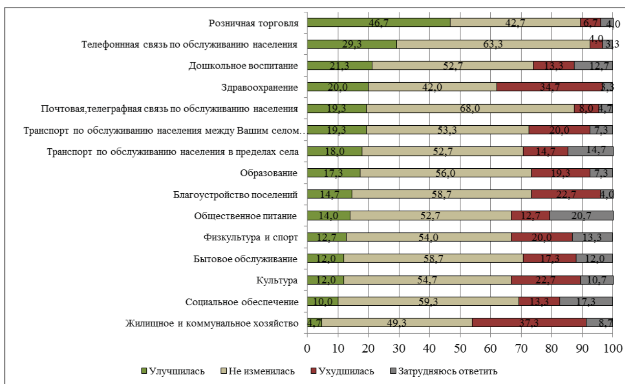
Рис. 6.3. Оценка изменений в социальной сфере за 2008-2013 гг. (мнение сельских жителей в 2013 г.), %

Высокие оценки ухудшения ситуации в здравоохранении в 2008-2013 гг. были зафиксированы нами и по результатам опроса сельских жителей в 2013 г. (рис. 6.3), это было значительно выше аналогичной оценки в 2008 г. Помимо здравоохранения, в 2013 г. наибольшую неудовлетворенность у сельского населения вызывали, еще и изменения в жилищном и коммунальном хозяйстве.