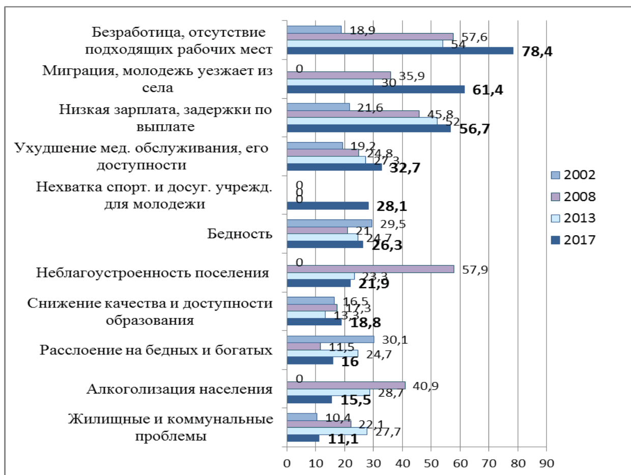
Рис. 6.1. Оценка сельскими жителями наиболее острых социально-экономических проблем в развитии села в 2002, 2008, 2013 и 2017 гг., % к массиву респондентов 1

По оценкам сельских жителей, в 2017 г. тройка наиболее значимых вызовов социально-экономическому развитию села не изменилась (см. рис. 6.1), но существенно вырос рейтинг безработицы (более 78%), а миграция заняла уже второе место, опередив низкую заработную плату (61% против 57%). Значительно больший вес набрала проблема ухудшения качества и доступности медицинского обслуживания (33%). Близкие масштабы остроты у проблемы нехватки спортивных и досуговых учреждений для молодежи (28%). Каждый четвертый сельский жителей выделил низкий размер пенсий и социальных пособий и бедность. Причем рейтинг проблемы бедности почти не изменился, не-