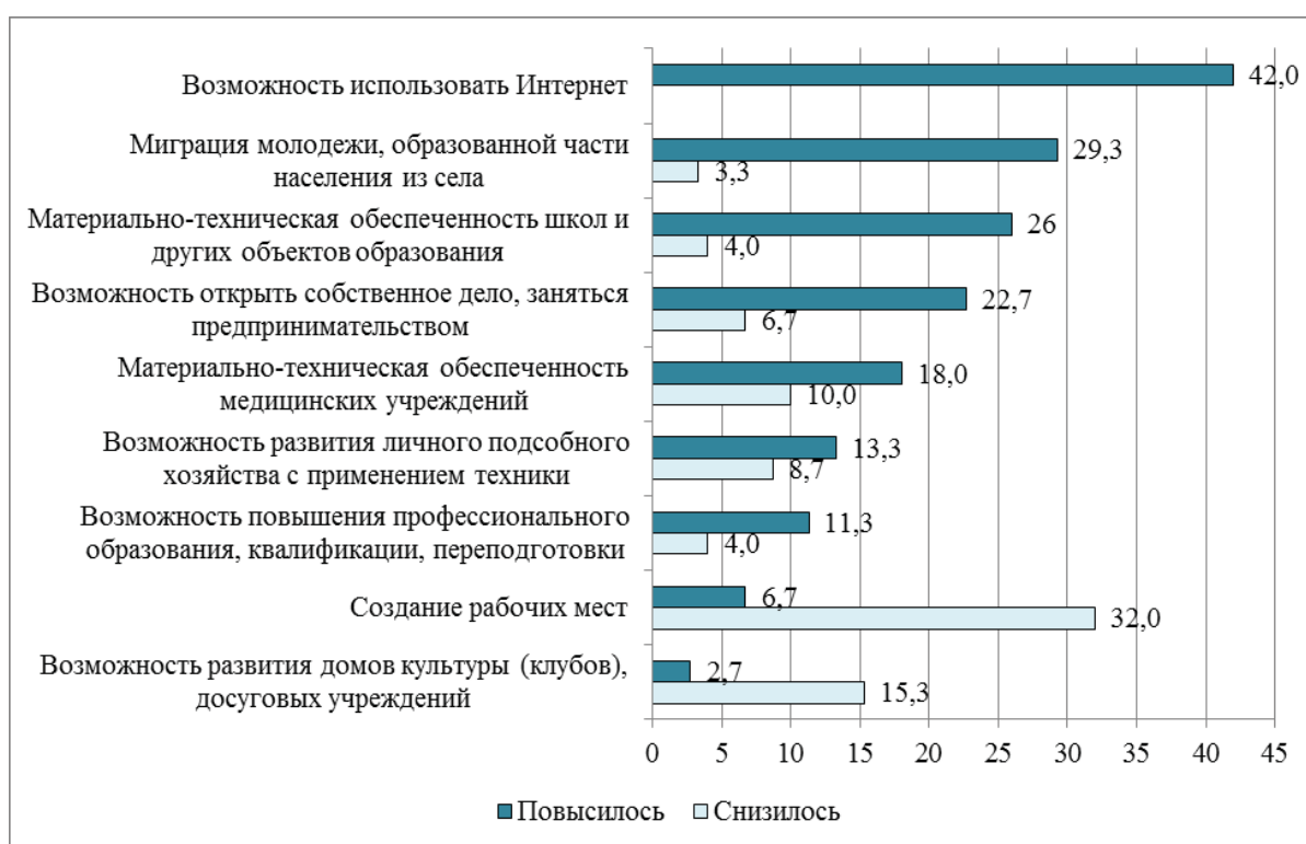
Рис. 6.2. Социально-экономические изменения в развитии села в 2008-2013 гг. (по мнению сельских жителей), %

Со второй половины 2000-х гг. в селе изменения в образовании и здравоохранении были связаны с обновлением материально-технической базы и применением новых технологий, хотя происходили они точечно и несистемно 1 . В отдельных селах, районах появились новое медицинское и школьное оборудование, компьютерные классы, Интернет, повысилась оплата труда медицинских работников и учителей. Возможность медицинской диагностики и первичной медицинской помощи сельских жителей с 2011 г. осуществляется с помощью «Автопоезда «Здоровье» в соответствии с установленным графиком, что особенно актуально для жителей небольших удаленных сел, не имеющих необходимой кадровой и материальной базы.