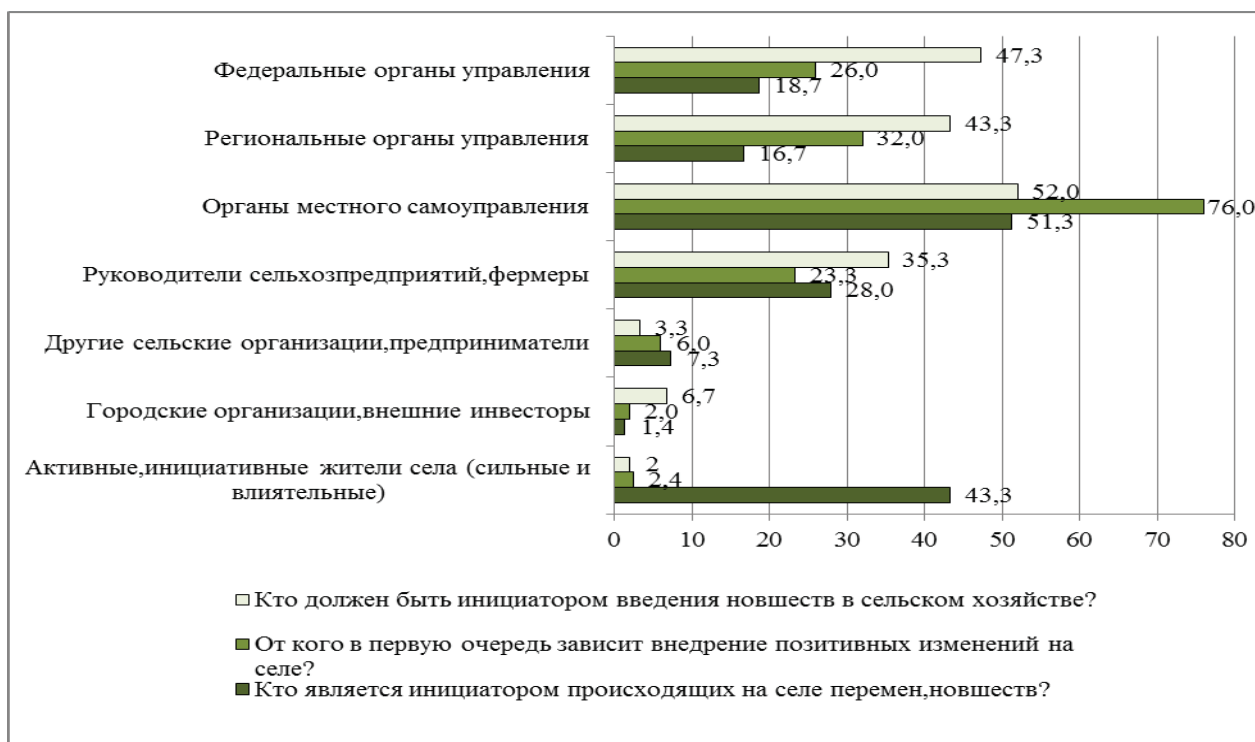
Рис. 13.1. Инициаторы перемен, внедрения инноваций на селе, % (опрос сельских жителей в 2013 г.)

В связи с этим как оценивают сельские жители действия государства и местной власти по внедрению инноваций в последние годы? Оценки действий государства преимущественно невысоки по всем сферам (от 8 до 20% «отличных» и «хороших» оценок) – рис. 13.2. Наиболее высокие оценки получены в сферах образования, здравоохранения и сельского хозяйства, а наиболее низкие (36 и 45% «плохих» оценок) – по развитию рынка труда и жилищно-коммунального хозяйства.