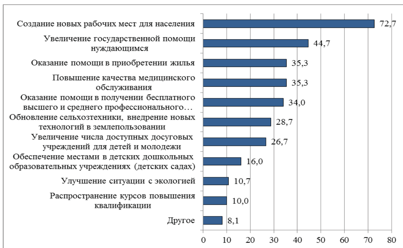
Рис. 13.5. Факторы прожективных позитивных перемен в социально-экономическом развитии села («Что будет способствовать позитивным изменениям в социально-экономическом развитии села?»), по мнению сельских жителей в 2013 г., %

Оценки экспертов и сельской молодежи, полученные в 2017 г., во многом коррелируют с результатами более ранних опросов сельских жителей. Так, по опросу сельских жителей в 2013 г., способствовать позитивным изменениям в развитии села будет в первую очередь создание новых рабочих мест (так считали почти \frac{3}{4} респондентов) и решение проблем в социальной сфере (в области социальной поддержки, обеспеченности жильем, образования, здравоохранения, культуры, 27-45% респондентов) – рис. 13.5.