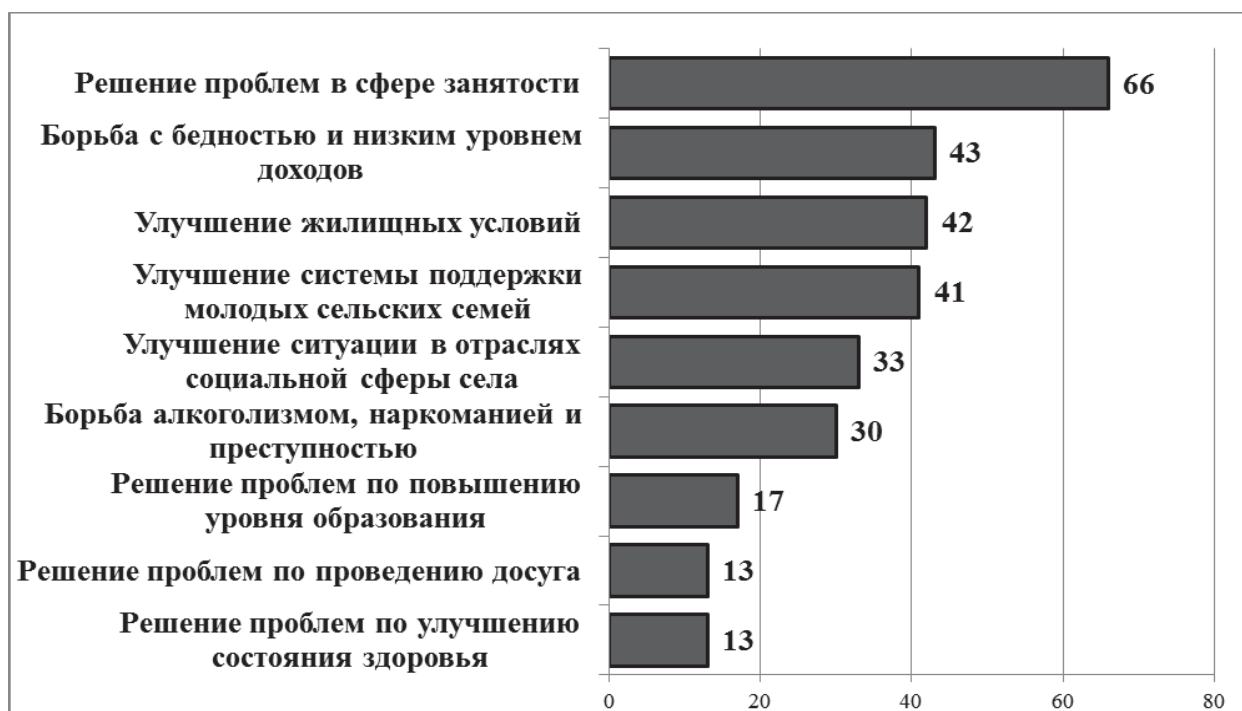
Рис. 13.4. Необходимые условия сокращения миграционного оттока сельской молодежи Алтайского края, % (по данным опроса сельской молодежи в 2016 г.)

По опросам 2016 и 2017 гг., оценки молодых селян относительно ключевых факторов или необходимых условий, которые в будущем могут повлиять на сокращение миграционного оттока сельской молодежи Алтайского края, значительно совпадают, что говорит об устойчивости результатов исследований. Так, по опросу 2016 г., среди таких факторов-условий лидирует (со значительным отрывом) решение проблем занятости молодежи на селе (66% опрошенных) – рис. 13.4. В первую пятерку вошли также меры по борьбе с бедностью и низким уровнем доходов молодежи (43%), улучшению жилищных условий (42%), развитию системы поддержки молодых сельских семей (41%). Большую актуальность имела также политика улучшения ситуации в отраслях социальной сферы в местах проживания (33%).