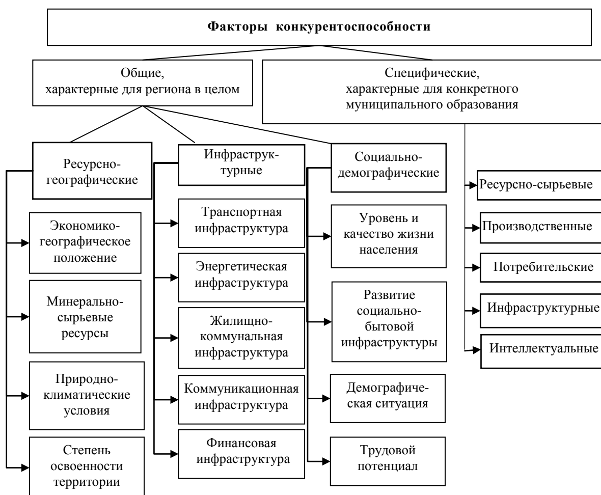
Рис. 1.2. Классификация факторов региональной конкурентоспособности

Названные факторы могут быть подразделены на общие и специфические . К специфическим факторам следует отнести некие характеристики муниципального образования (экономико-географическое положение, природные ресурсы, демографический и социально-экономический потенциалы и т.п.), детерминирующие уровень и темпы развития его экономики 1 (рис. 1.2). Воздействием именно специфических факторов, отражающих индивидуальные особенности муниципального образования, объясняют существенные различия в уровне и темпах его развития.