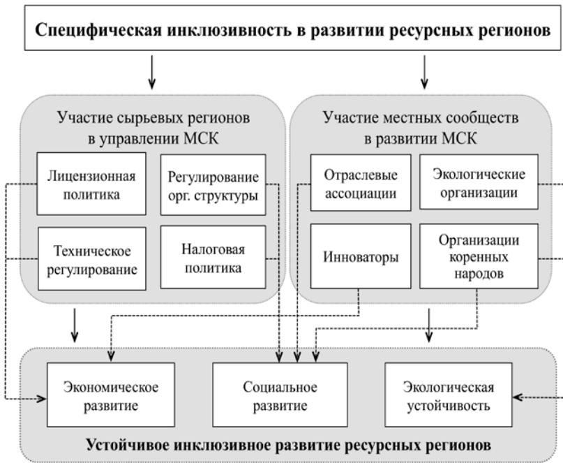
Рис. 3.2. Специфическая (расширенная) инклюзивность и устойчивое развитие

инклюзивности. В данном контексте под специфической инклюзивностью понимаются возможности активного и значимого участия региональных органов власти в управлении и регулировании МСК, а также вовлеченность в развитие МСК, в процессы обсуждения принимаемых стратегических решений местных сообществ – экологических организаций; организаций, представляющих интересы коренных малочисленных народов; локальных отраслевых ассоциаций; представителей инновационного комплекса и других местных сообществ (рис. 3.2).