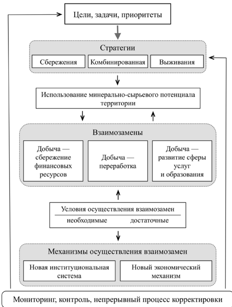
Рис. 3.1. Условия и направления перехода сырьевых территорий на траектории устойчивого развития