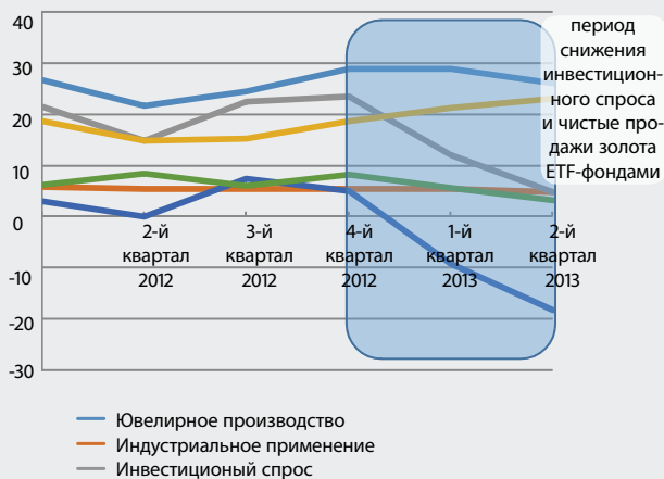
РИС. 2 Динамика спроса на золото в мире поквартально в 2012-2013 гг. по сегментам его применения и использования в млрд долл.

Источник: Thomson Reuters GFMS, World Gold Council