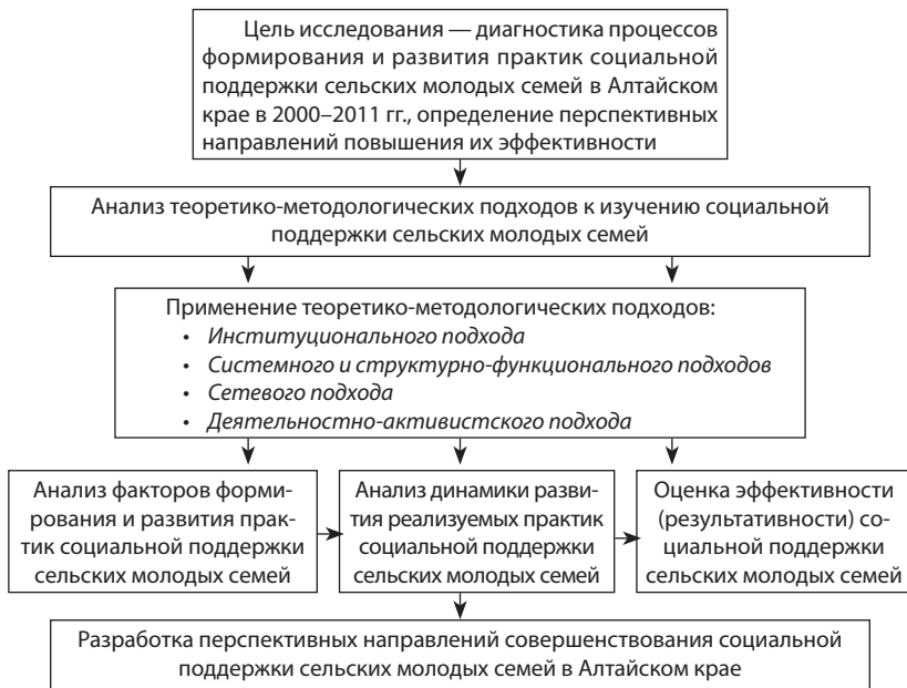
Рис. 4.1. Логическая схема исследования процессов формирования и развития практик социальной поддержки сельских молодых семей в Алтайском крае в 2000–2011 гг.

В социологии семьи для исследования репродуктивного поведения личности и семьи создано множество технических приемов и средств. Одним из способов изучения репродуктивного поведения является анализ таких показателей, как «идеальное», «желаемое» и «ожидаемое» число детей в семье. Истоки его происхождения уходят в 30-е гг. 20 в. «Идеальное число» трактуется как отражение социальной нормы детности, «желаемое число» — как индикатор потребности в детях, «ожидаемое число» — как установочные ориентации, репродуктивные установки, прогнозирующие тенденции рождаемости.