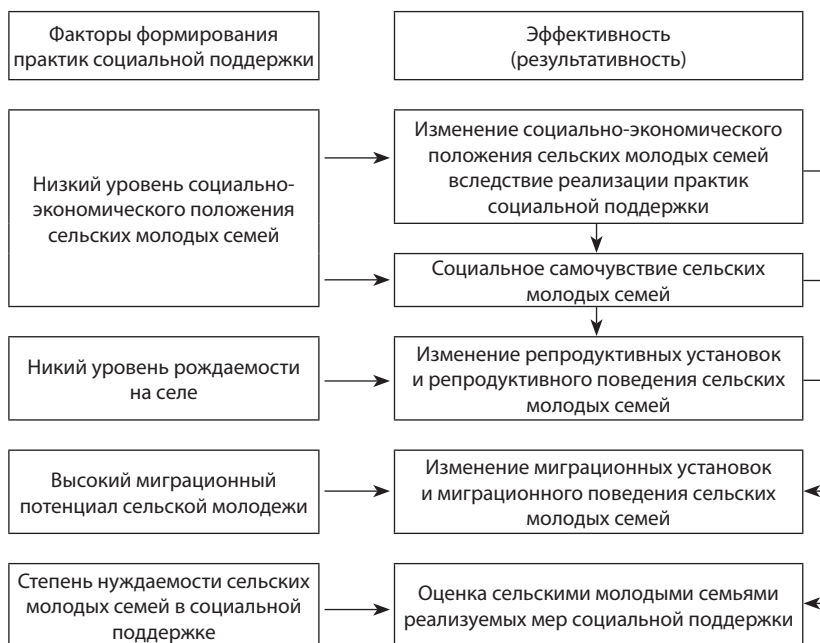
Рис. 7.1. Критерии оценки эффективности социальной поддержки сельских молодых семей

ненной ситуации и поставленных на учет в органы социальной защиты населения; роста показателей по улучшению жилищных условий сельских молодых семей (изложено в п. 7.1 монографии).