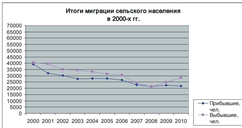
Рис. 5.1. Итоги миграции сельского населения Алтайского края в 2000–2010 гг.