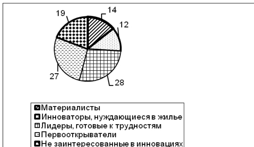
Рис. 2. Типология молодежи в зависимости от их мотивации труда в сфере инновационного предпринимательства, N=1535

5. Стремление части молодежи к труду в инновационной сфере подтверждается и активным ее участием в разного рода тренингах, способствующих развитию человеческого потенциала. В частности, этому способствуют тренинги навыков, личностного роста, по развитию коммуникаций и лидерских качеств.