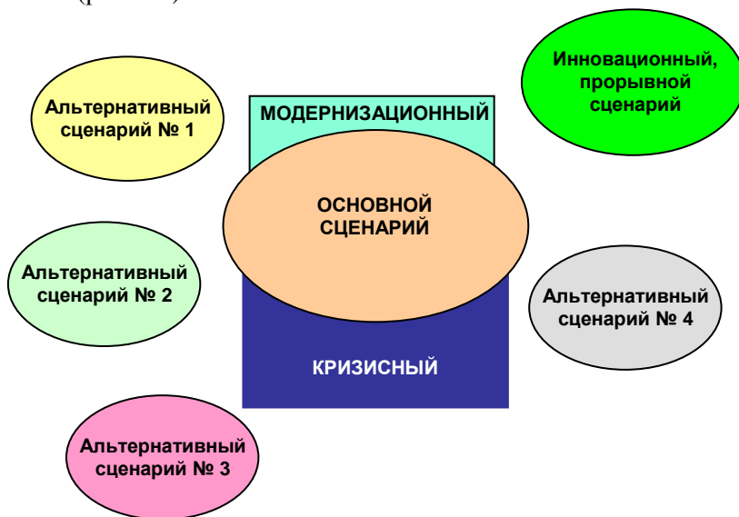
Рис. 5.2. Пространство сценариев

Предлагаемые сценарии не сводятся к традиционному для экономических прогнозов набору: «инерционный», «оптимистичный» и «пессимистичный» сценарии; выстроено широкое сценарное поле будущего, включающее основной сценарий и ряд альтернативных сценариев. В сценарном поле каждый раз (для экономики, образования, здравоохранения) рассматривался кризисный сценарий, как возможный, но не обязательно высоковероятный (рис. 5.2).